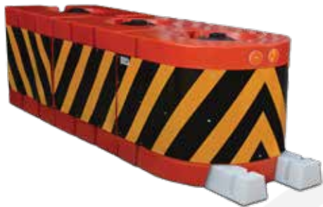
کاشن تانک ست اتوبانی کامل ۹۰

ویژگی های کاشن تانک ترافیکی جهت ایجاد فضای امن مورد استفاده قرار می گیرند استفاده از شبرنگ مناسب در محصول ، به منظور جلوگیری از برخورد لوازم نقلیه با آن از اهمیت بالایی برخوردار می باشد کاشن تانک دارای طول عمر بالا و همچنین مقاومت در مقابل سرما و گرما شدید می باشد کاشن تانک از تجهیزات ایمنی ترافیکی می باشد که در بسیاری از مکان ها جهت ایجاد فضای امن در مقابل برخوردها و همچنین به عنوان جدا کننده مورد استفاده قرار می گیرند کاشن تانک به دلیل استفاده از مواد پلی اتیلن و شبرنگ مرغوب از بین مدل های متعدد انتفاع گردیده است استفاده از شبرنگ ( مراقب باشید که بر چسب روز رنگ به شما ن فروشند مناسب در محصول به منظور جلوگیری از برخورد لوازم نقلیه با آن از اهمیت بالایی برخوردار می باشد این محصول مخزنی از جنس پلاستیک می باشد و طراحی خمیده دارد