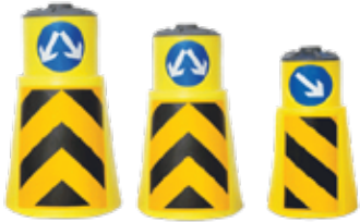
بشکه ترافیکی با درب و شبرنگ